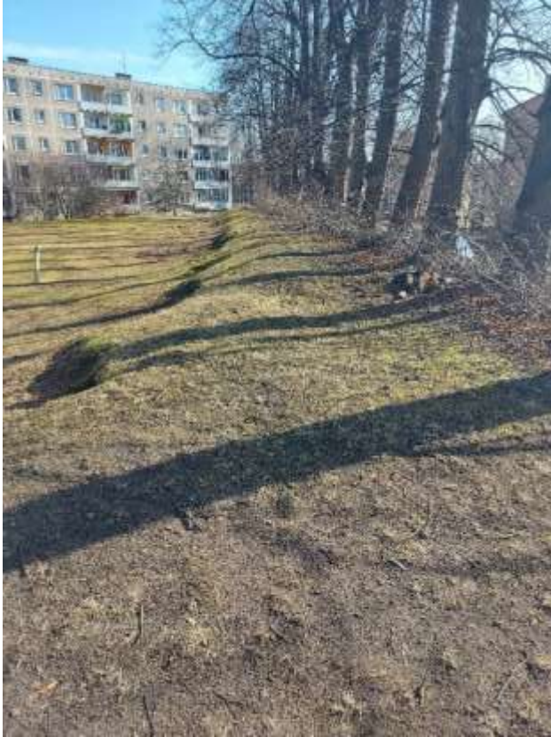
(Attēls pa kreisi: Baltās muižas parka aleja, Spilves iela 5. Autors: Edgars Tomans)