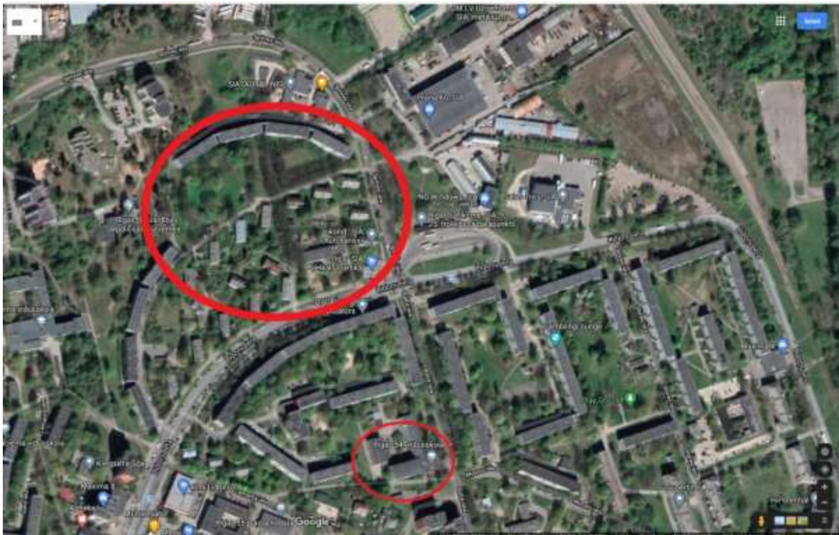
(Ar lielo apli: Aptuvenā Baltās muižas teritorija mūsdienās. Ar mazo apli: pašreizējā Rīgas 54. Vidusskola)