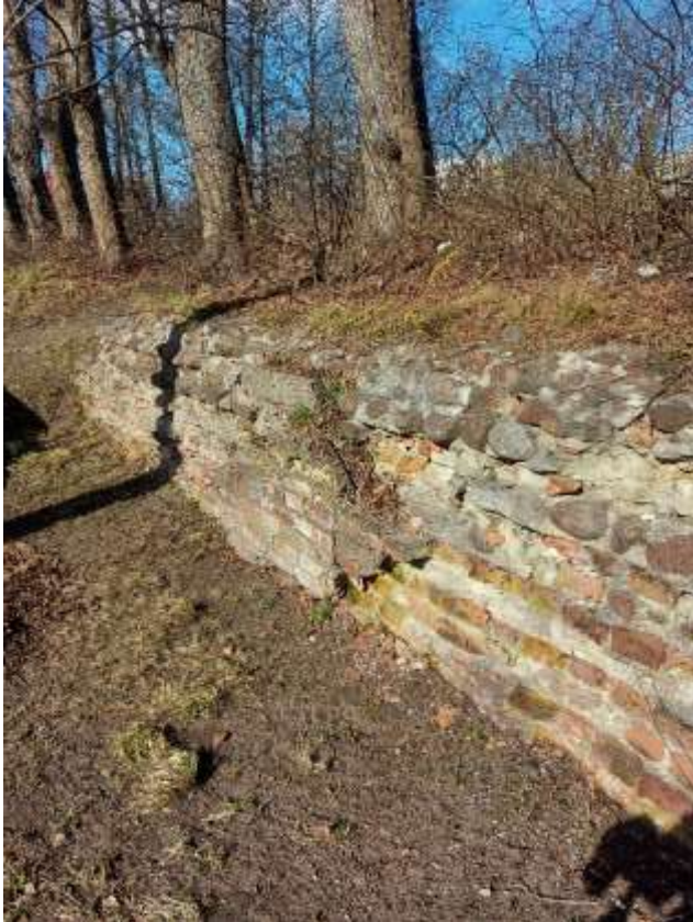
(Attēls pa kreisi: Varbūtējas muižas atliekas Spilves ielā 5. Autors: Edgars Tomans)