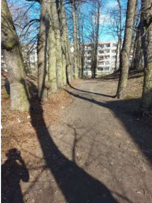
(Attēls pa kreisi: Baltās muižas parka aleja, Spilves iela 5. Autors: Edgars Tomans)