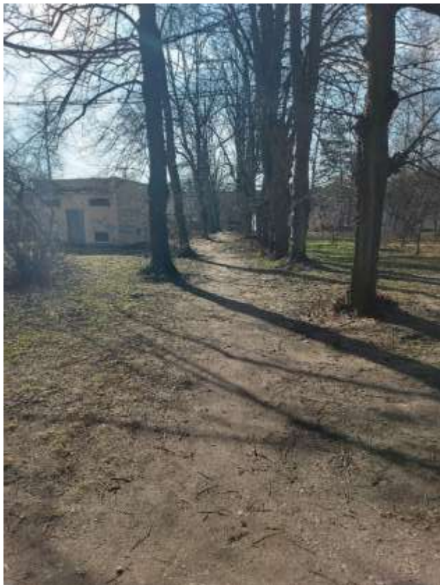
(Attēls pa kreisi: Baltās muižas parka aleja, Spilves iela 5. Autors: Edgars Tomans)