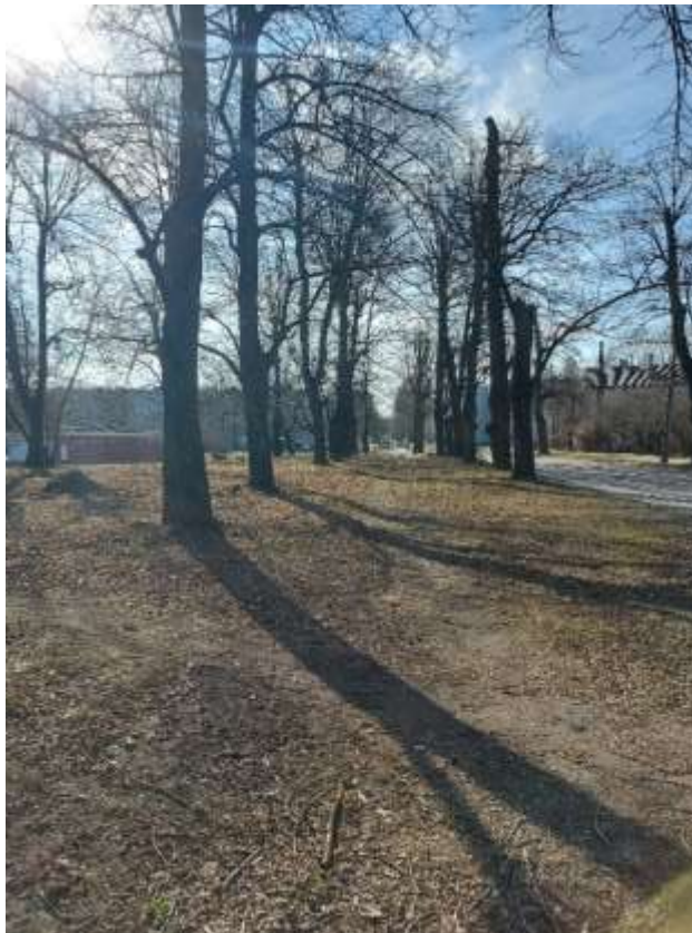
(Attēls pa kreisi: Baltās muižas parka aleja. Skats uz krustojumu ar Spilves ielu un Lidoņu ielu. Autors: Edgars Tomans)